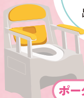
ポータブルトイレ